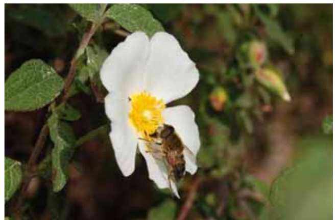
Autor: Esteve Ballescà.