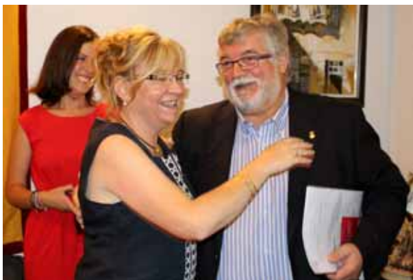
Berdala i Lera es feliciten un cop segellat l'acord de govern