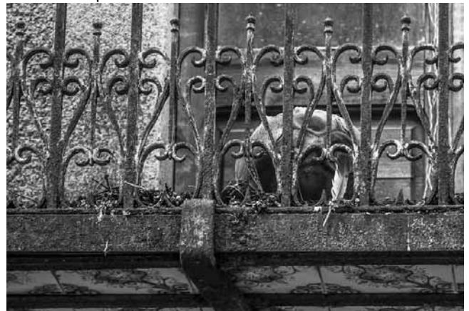
Autor: Teo González.